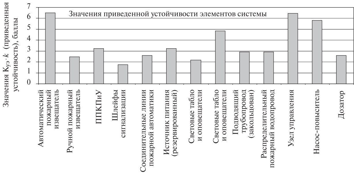
Рисунок А.2 – Графическая интерпретация расчета устойчивости (после внесения изменений)

Улучшение устойчивости АУПТ можно продолжить, определив по рисунку А.2 элементы с минимальной устойчивостью, например шлейфы пожарной сигнализации, и применив к ним такое решение, как резервирование кабельных линий.