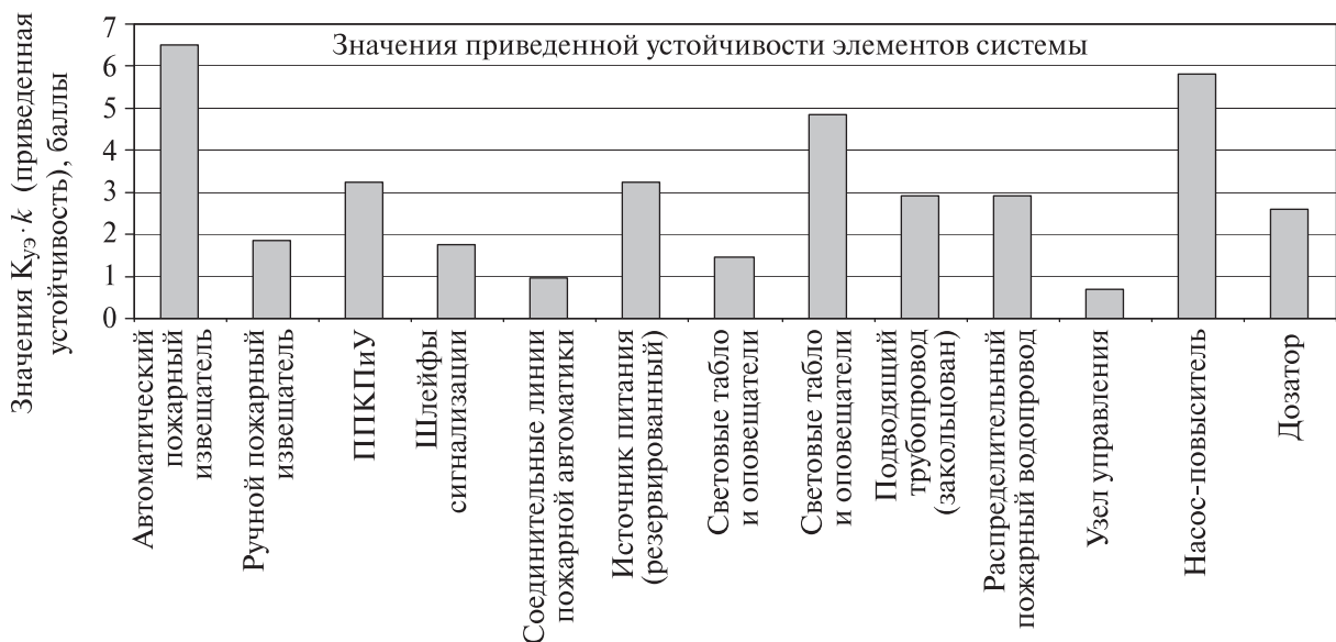
Рисунок А.1 – Графическая интерпретация расчета устойчивости

В качестве примера таких решений может служить перенос узлов управления в пожаро-безопасное помещение категории Д, увеличение количества ручных пожарных извещателей до четырех, увеличение количества световых табло и оповещателей в помещении категории В1 до трех, применение кабельных систем для соединительных линий пожарной автоматики с повышенным пределом огнестойкости (F60) и увеличение их количества (резервирование) до двух. При применении всех перечисленных решений показатель устойчивости системы составит 47,50 (увеличение устойчивости на 22,5 %), а диаграмма с графической интерпретацией расчета (рисунок А.2) покажет более равномерную картину устойчивости элементов системы.